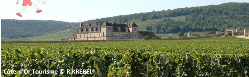
Côte-d'Or Tourisme © R. KREBEL